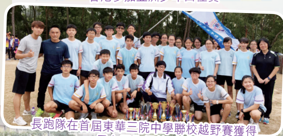
長跑隊在首屆東華三院中學聯校越野賽獲得男女子全場總季軍