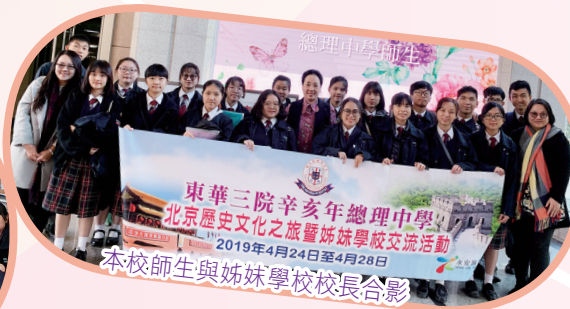
本校師生與姊妹學校校長合影