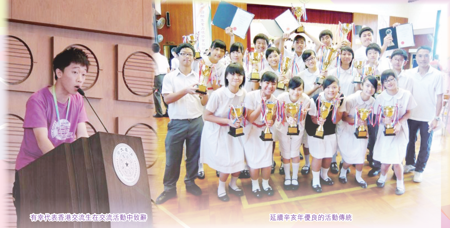
有幸代表香港交流生在交流活動中致辭