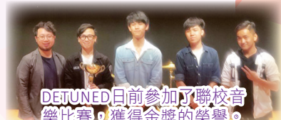
DETUNED日前參加了聯校音樂比賽，獲得金獎的榮譽。

今年DETUNED決定衝出學校，參與更多校外的表演及比賽，又曾經多次在明愛活動中演出。除了參加校外的表演外，DETUNED還作出了一次大無畏的決定，就是舉辦一場屬於自己的表演秀。由表演場地、演奏曲目，以致宣傳都是由隊員一手策劃，於聖誕節時成功舉行。DETUNED日前參加了聯校音樂比賽，獲得金獎的榮譽。