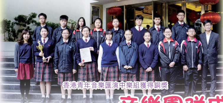
香港青年音樂匯演中樂組獲得銅獎