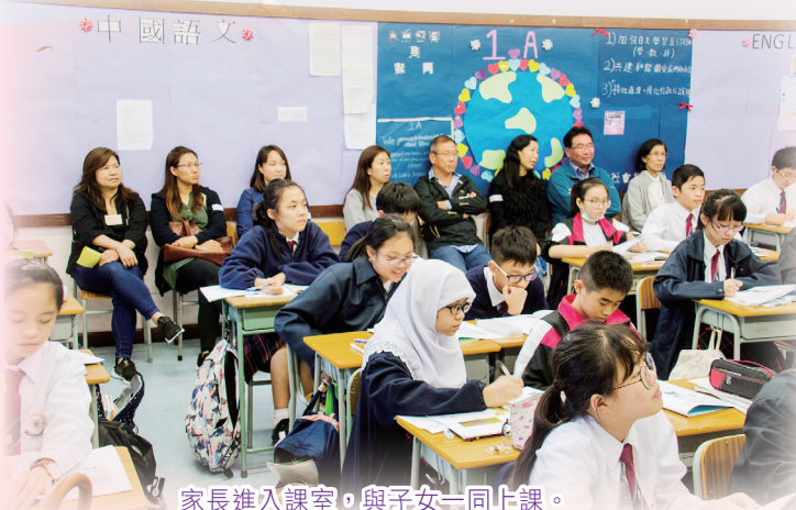
家長進入課室，與子女一同上課。