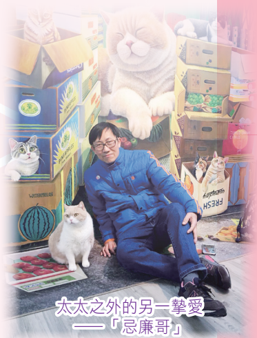
太太之外的另一摯愛 ——「忌廉哥」

劉：我們現時工作還很忙，所以打算退休后才開始想退休計劃——這就是我們的退休計劃了。