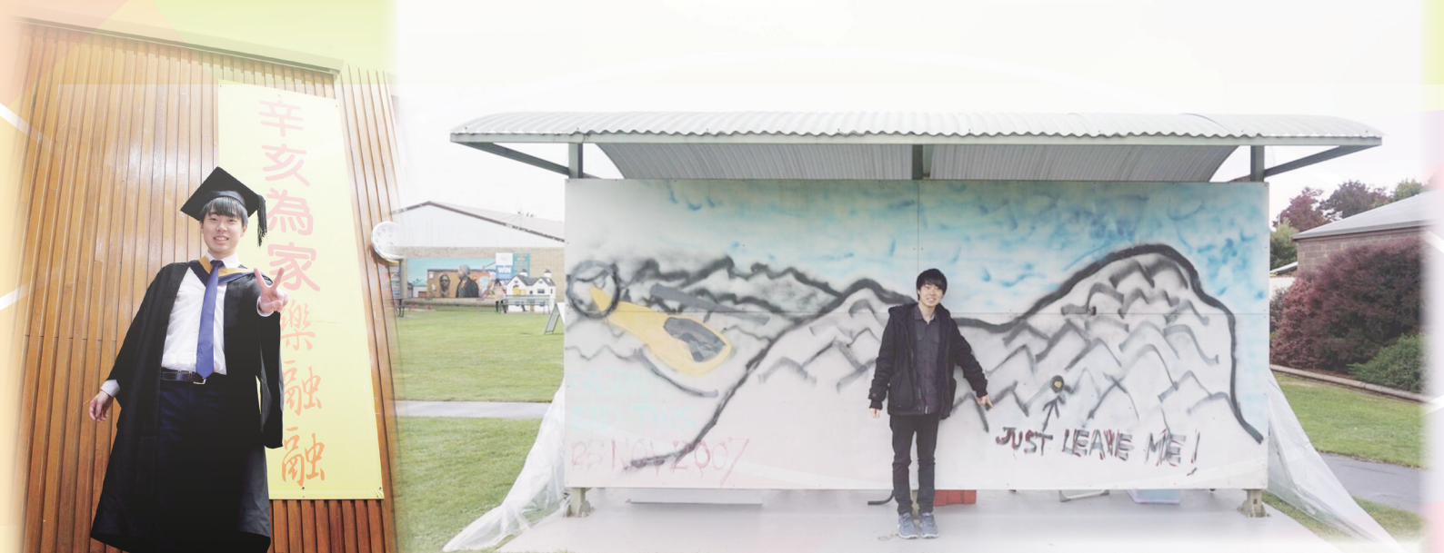
感謝辛亥年師長多年來對我的栽培