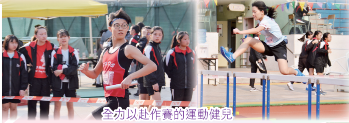
全力以赴作賽的運動健兒