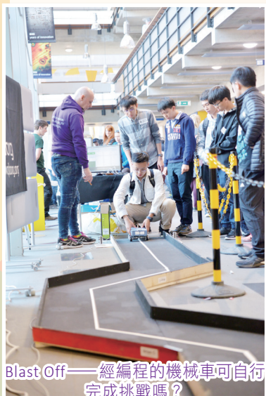
Blast Off——經編程的機械車可自行完成挑戰嗎？

3月底，10位同學代表本校到英國劍橋大學參與Pi Wars 2019比賽。比賽於3月30日在劍橋大學William Gates Buildings舉行，隊員以單晶片電腦Raspberry Pi為核心，設計了1架可編程的機械車，與來自英國及世界各地的學生進行了共7項挑戰任務的比賽，並獲得第7名。此外，這次旅程亦參觀了倫敦科學博物館及自然歷史博物館，同學獲益良多。是次比賽交流團的部份開支由東華三院及陳書賢基金贊助，謹此致謝。