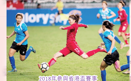
2018年參與省港盃賽事