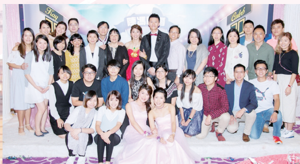
婚禮當天，辛亥年的老師、同事及同學們的祝賀與見證。