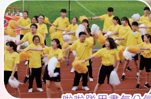
啦啦隊用盡每分氣力為健兒吶喊助威