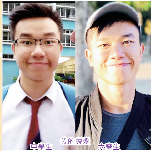
中學生 我的蛻變 大學生