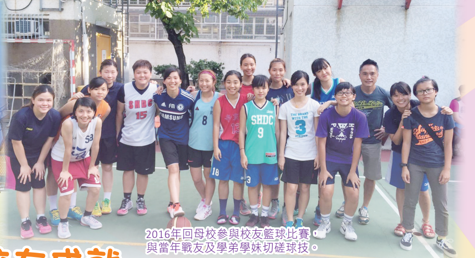
2016年回母校參與校友籃球比賽，與當年戰友及學弟學妹切磋球技。