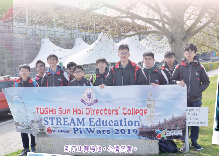
到了比賽場地，心情興奮。