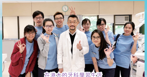
在港大的牙科學習生活