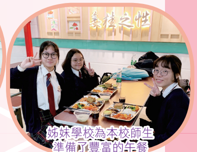
姊妹學校為本校師生準備了豐富的午餐