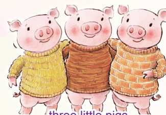
three little pigs