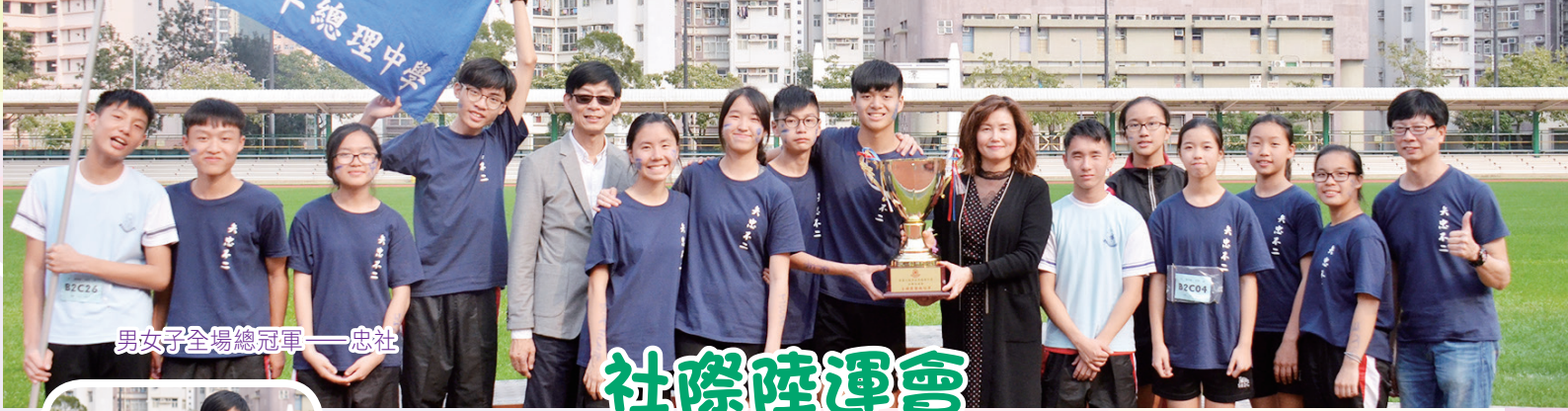
男女子全場總冠軍——忠社