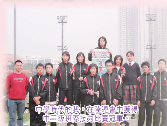
中學時代的我，在陸運會中獲得中三級班際接力比賽冠軍。

願正在辛亥年求學的學弟學妹，繼續努力朝目標進發，我相信你們總有一天能夠實現理想。