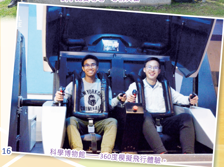
科學博物館——360度模擬飛行體驗。