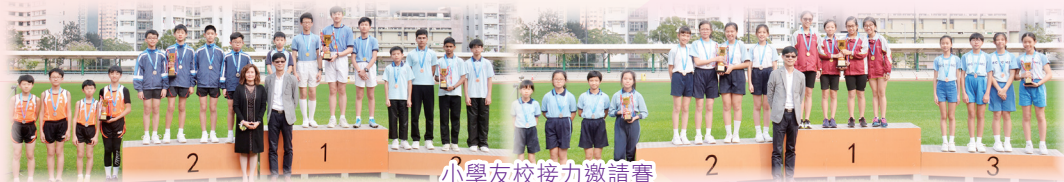
小學友校接力邀請賽