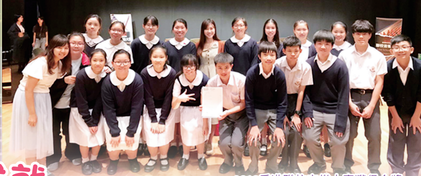
2019香港聯校音樂大賽獲得金獎

中樂團 於2019香港聯校音樂大賽獲得金獎、香港青年音樂匯演中樂組獲得銅獎及第71屆香港學校音樂節中樂小組獲得優良獎狀。