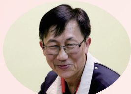
講起太太，劉老師一臉幸福。