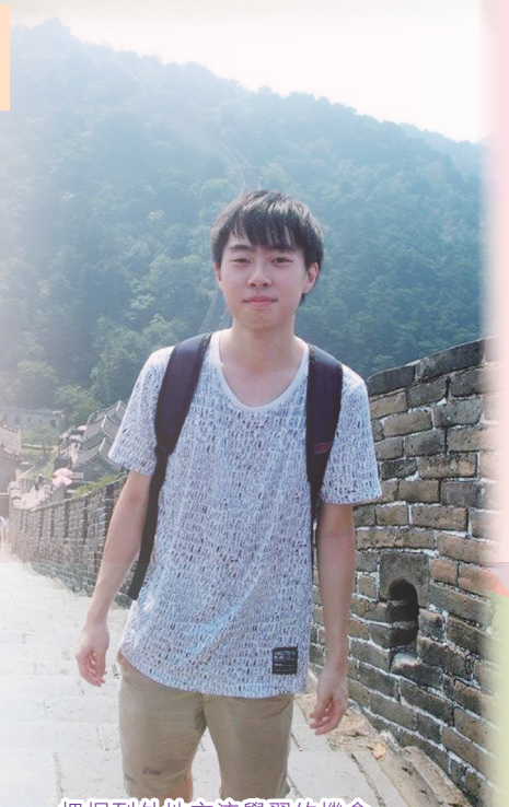
把握到外地交流學習的機會

此外，中學生涯裡尤其難得的是獲得了參與交流團的機會。中六那年，我有幸獲學校推薦到北京和上海交流。能夠步出教室，抱著學習的心態離開自己成長的城市到外地見識，這為我帶來深刻的體會，令我明白到若不嘗試往外闖，不放遠目光，必然無法領會世界的遼闊。及至大學時期，我亦把握機會到澳洲留學交流，既能增廣見聞，也能體驗當地文化。即使現在工作繁重，也想把握每個假期，走訪更多小城大國，感受更多風土人情，擴闊眼界。