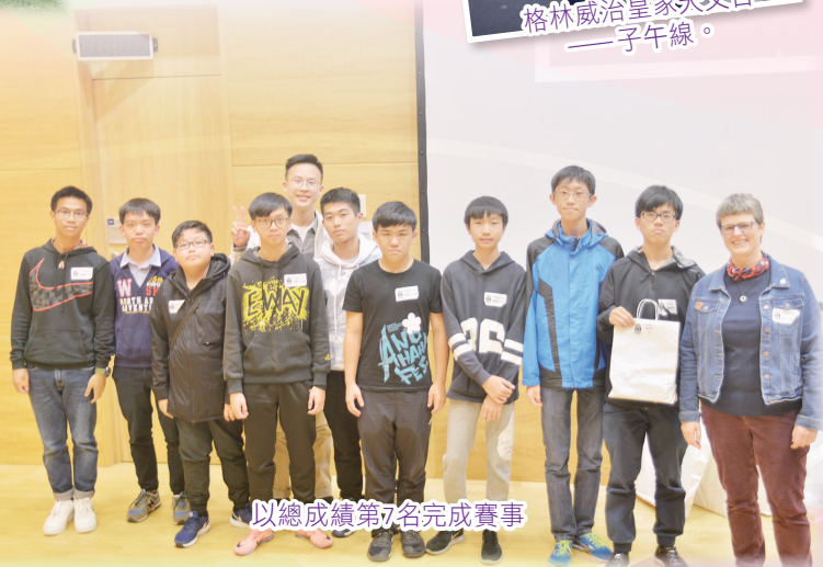
以總成績第7名完成賽事