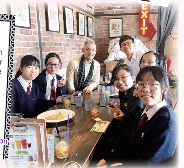
Each student presents an invitation to a teacher and a student to authenticate the experience.