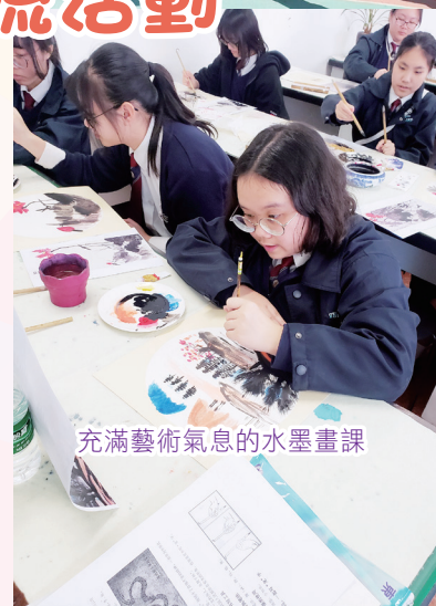
充滿藝術氣息的水墨畫課

本校師生在抵達北京翌日，即前往姊妹學校——北京市第一七一中學參訪。本校師生受到熱情的招待，除了觀摩了姊妹學校的語文及歷史課外，亦親身體驗了書法和水墨畫課。透過此次參訪，讓本校師生更了解內地的教育現況，更促進兩校之間的友誼。衷心期待日後兩校有更多交流、合作的機會。