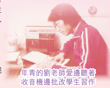
年青的劉老師愛邊聽著收音機邊批改學生習作