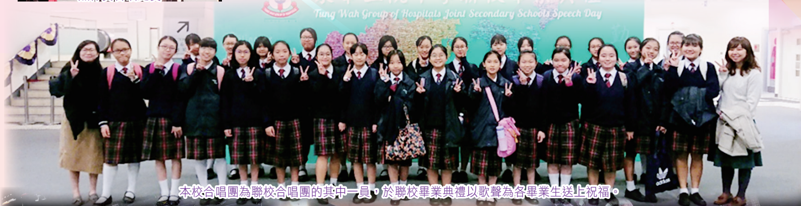
本校合唱團為聯校合唱團的其中一員，於聯校畢業典禮以歌聲為各畢業生送上祝福。