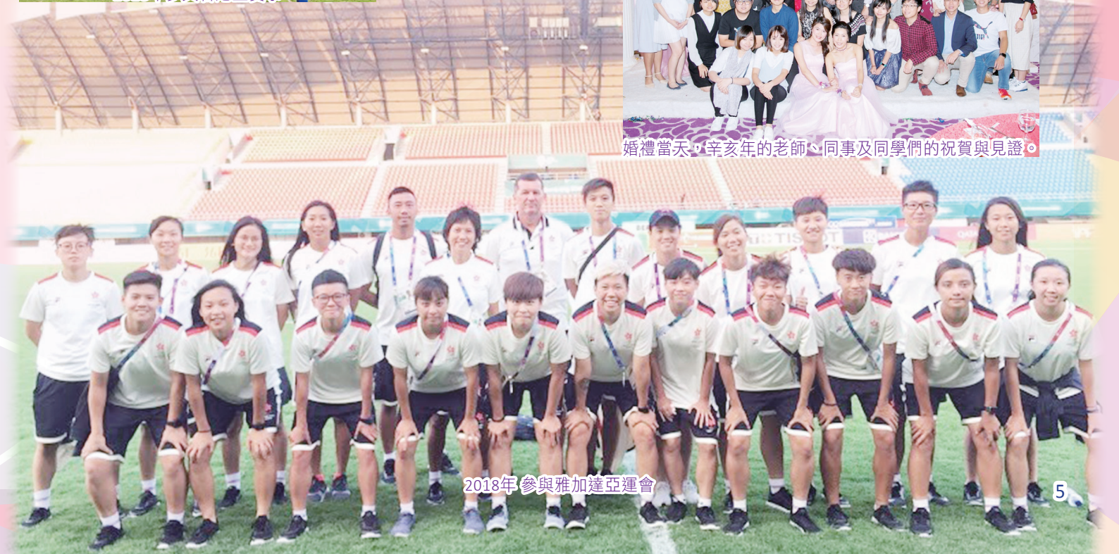
2018年參與雅加達亞運會