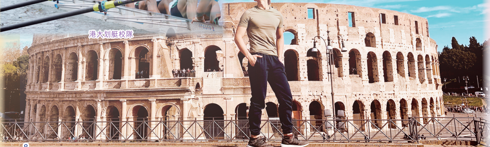
放眼世界，遨遊歐洲。