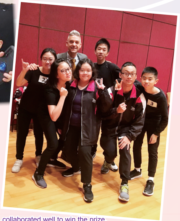
The team, composed of students of various forms and classes, collaborated well to win the prize.