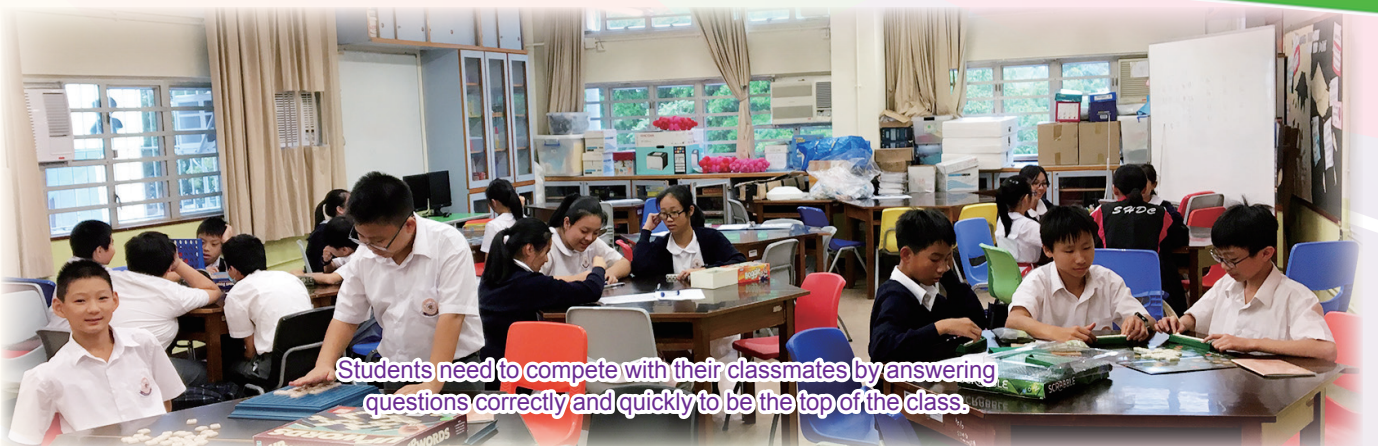
Students need to compete with their classmates by answering questions correctly and quickly to be the top of the class.