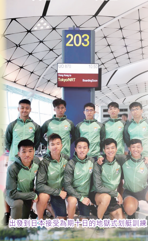
出發到日本接受為期十日的地獄式划艇訓練

「落其實者思其樹，飲其流者懷其源」我永遠都不會忘記在辛亥年學懂的道理，我定必會盡自己最大的努力回饋母校。願辛亥年有更好發展，培育更多才德兼備的優秀人才！