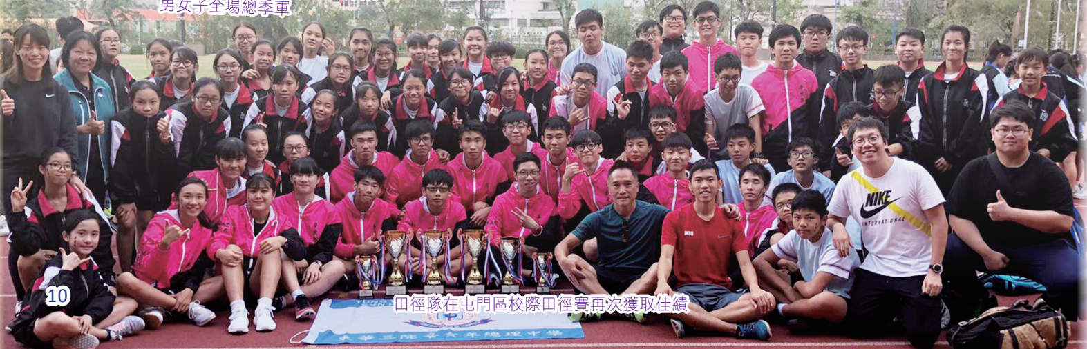
田徑隊在屯門區校際田徑賽再次獲取佳績