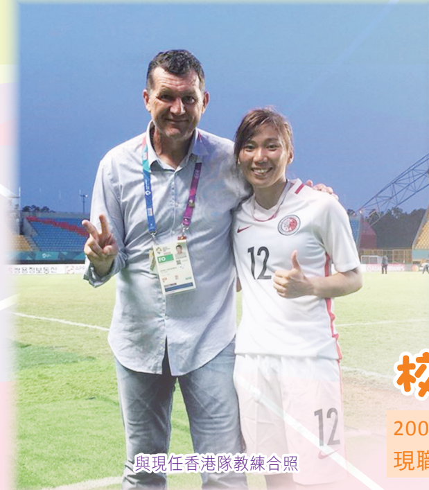
與現任香港隊教練合照