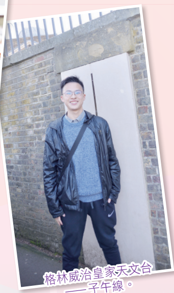
格林威治皇家天文台——子午線。