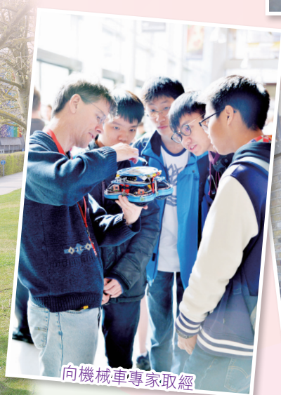
向機械車專家取經