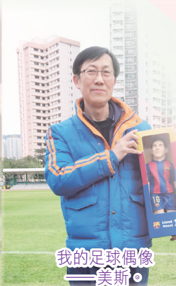
我的足球偶像——美斯。