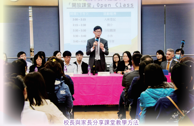
校長與家長分享課堂教學方法

本年度開放課堂活動，已於3月6日下午順利舉行。當日本校共開放22節課堂，讓家長了解本校老師授課及學生學習的情況。是次共有77名家長出席觀課，當中三成為本校學生家長，七成為本區小學家長。活動後大部份家長均認為，觀課有助他們認識本校學生的學習情況。