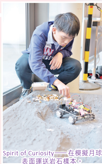
Spirit of Curiosity——在模擬月球表面運送岩石樣本。