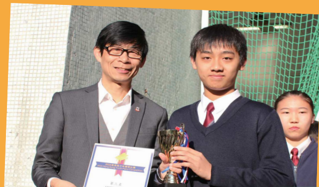
2016 香港青少年鋼琴大賽少年組 第二名