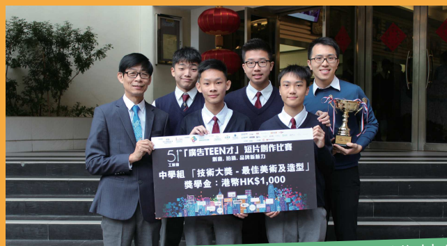
第51屆工展會「廣告Teen才」短片創作比賽 全場技術大獎 (最佳美術及造型)