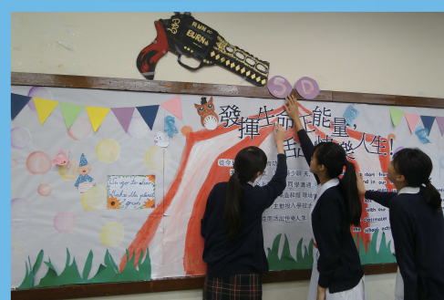
班際壁報設計比賽