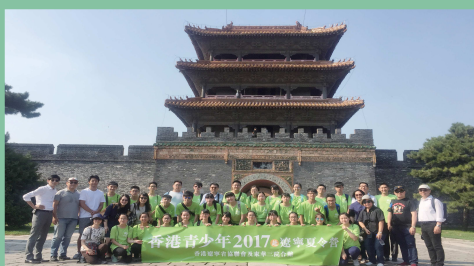
「遼港青少年夏令營2017」