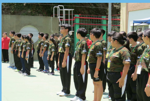
中一升中二領袖訓練營