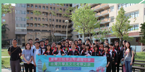
台灣升學及文化考察之旅