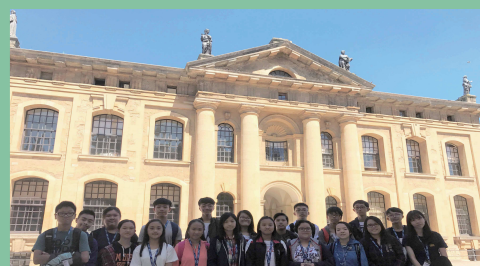
2017年英國文化探索之旅