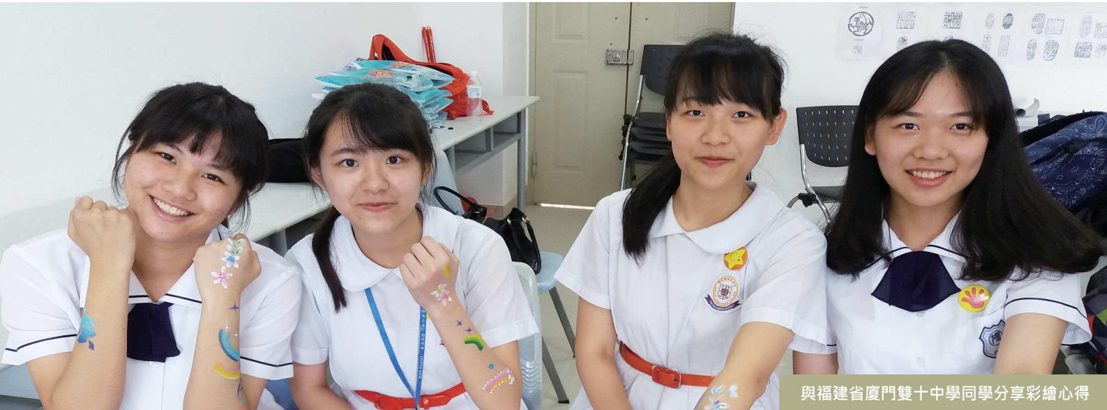
與福建省廈門雙十中學同學分享彩繪心得