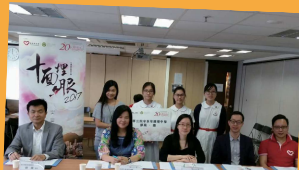
十面埋「服」2017社會創新服務大賽 亞軍