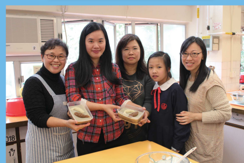
家教會新春食物製作班