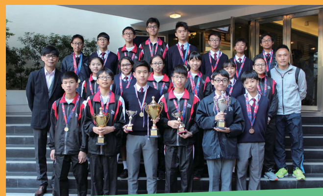
屯門區分齡田徑賽、校際野賽 勇奪佳績