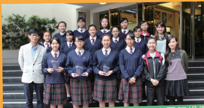
第五十三屆學校舞蹈節榮獲中學中國舞組優等獎 荃灣區舞蹈比賽公開組獲得金獎