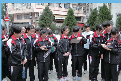
通識移動學習活動