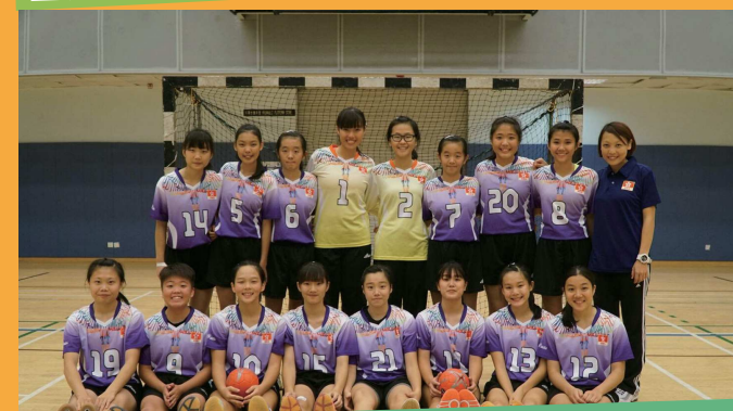
香港女子青年隊出戰中港澳盃手球賽 冠軍