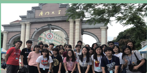
《東華辛亥·廈門雙十》 姊妹學校交流團