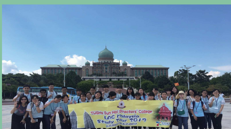
馬來西亞文化探索之旅

學生每年皆有不少機會參加由學校或其他機構舉辦的境外參觀或交流活動。同學透過參與這些活動，可擴闊的視野，認識不同國家的文化，成為一位具世界視野的公民。